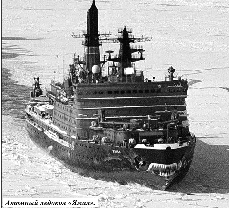
Атомный ледокол «Ямал».