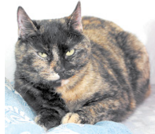
Варваре 5 лет. Как и все приютские кошки, она привита и стерилизована.